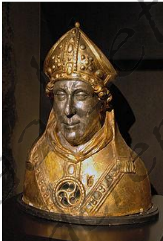
Engelbert I van Keulen

Hij werd op 15 november 1225 gekozen, slechts één week na de moord op zijn voorganger Engelbert I van Keulen.