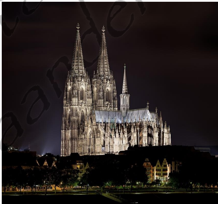
Dom van Keulen