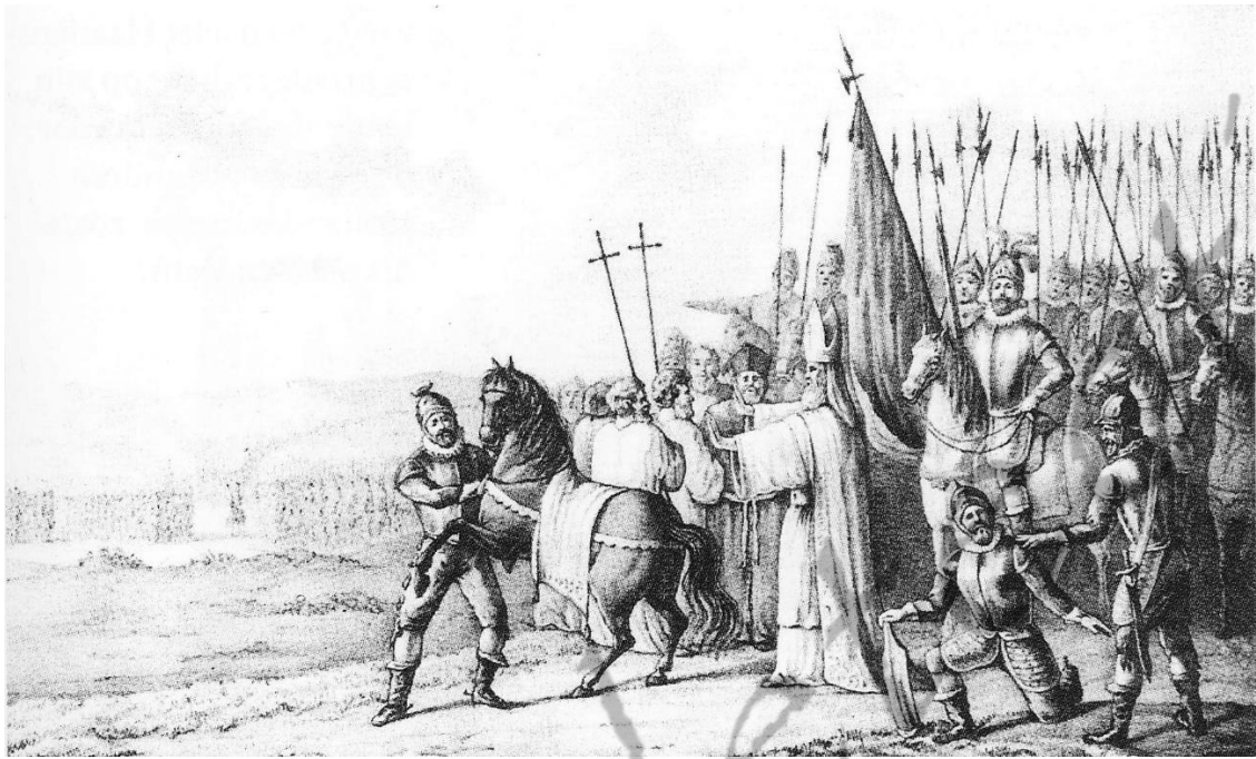
Otto II van Lippe spreekt de banvloek uit over Rudolf II van Coevorden.