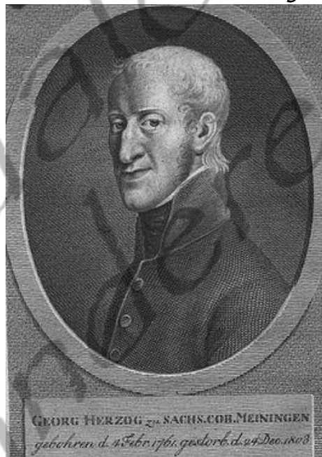
George I van Saksen-Meiningen

Adelheid raakte snel zwanger, maar werd in de zevende maand ernstig ziek en beviel op 27 maart 1819 voortijdig van een dochter, Charlotte, die maar enkele uren leefde. Op 10 december 1820 werd een tweede dochter geboren, Elizabeth, die op 4 maart 1821 stierf.