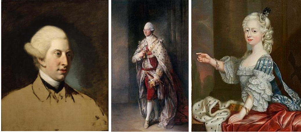
Willem Hendrik van Gloucester, Hendrik Frederik van Cumberland en Strathearn en Augusta Frederika van Hannover

Het grootste deel van zijn jeugd bracht hij door in Richmond en te Kew, in Londen. Hij werd opgevoed door privéleraren.