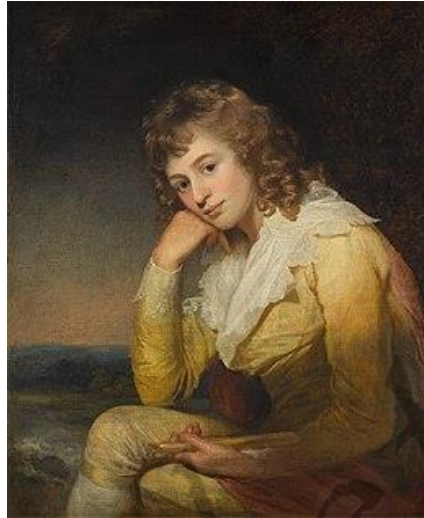
Mrs. Dorothea Jordan

Nadat hij de Koninklijke Marine had verlaten, woonde de hertog van Clarence meer dan twintig jaar samen met de Ierse actrice Dorothea Bland, beter bekend onder haar pseudoniem Dorothea Jordan.