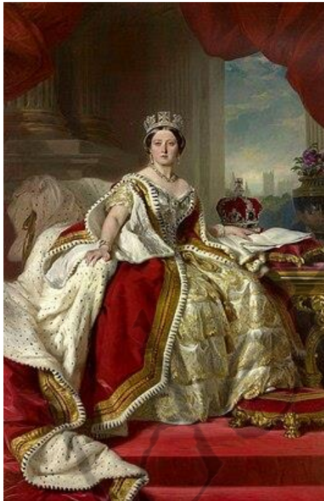
Victoria van het Verenigd Koninkrijk

Hij had geen wettige kinderen en werd opgevolgd door zijn nicht prinses Victoria van Kent, de enige dochter van prins Eduard August.