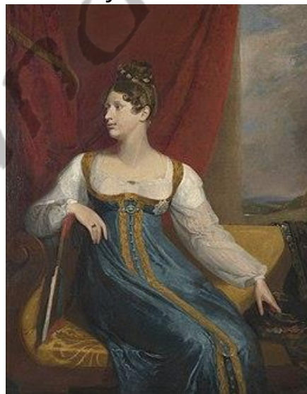
Charlotte Augusta van Wales

Toen prinses Charlotte Augusta, het nichtje van Willem en dochter van de Prince Regent (en de tweede in lijn van de troonopvolging na haar vader) stierf in het kraambed op 6 november 1817, bleef koning George III achter met weliswaar twaalf kinderen, maar geen wettige kleinkinderen. Vanaf dat moment stortten alle hertogen van koninklijke afkomst zich in huwelijken.