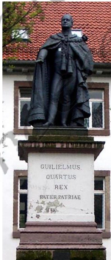
Standbeeld van Willem IV opgericht in Göttingen in 1837 ter gelegenheid van de 100ste verjaardag van de oprichting van de universiteit.