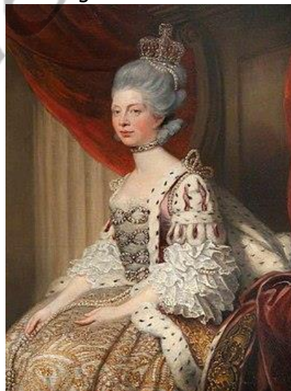
George III van het Verenigd Koninkrijk en Charlotte van Mecklenburg-Strelitz