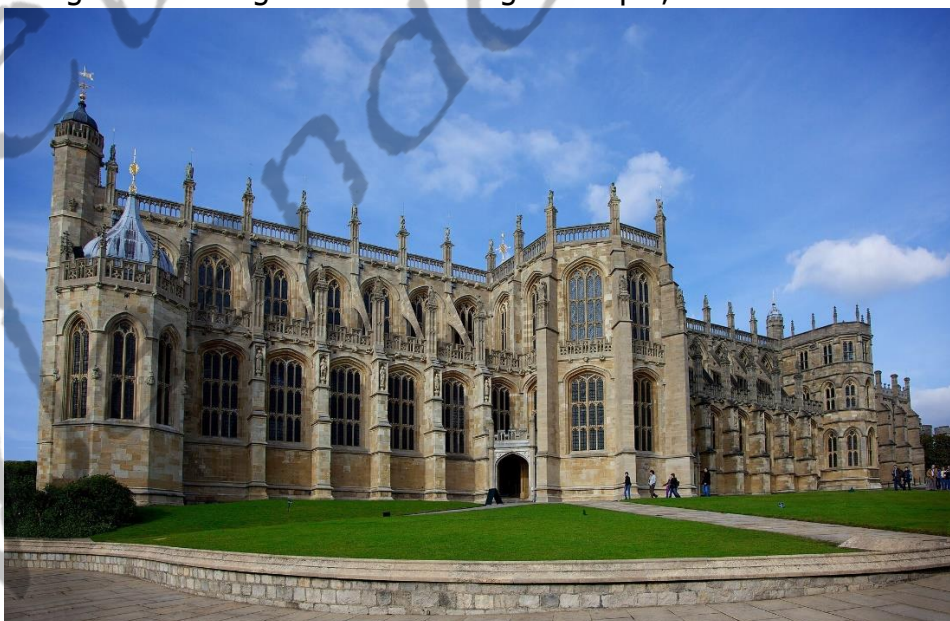
St George's Chapel

Aangezien deze regering slechts door een minderheid werd gesteund was die een kort leven beschoren. Na korte tijd kwamen de liberalen (Whigs) weer aan de macht. Willem IV stierf in de vroege uren van 20 juni 1837 op 71-jarige leeftijd aan een longontsteking en werd begraven in St George's Chapel, Windsor Castle.