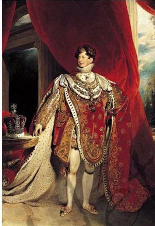
George IV van het Verenigd Koninkrijk

(Zijn oudere broer Frederik was drie jaar eerder overleden.) Willem IV was de oudste Britse vorst op zijn troonsbestijging tot 2022 naar hij werd overtroffen door Charles III, in zijn drieënzeventigste jaar toen hij op te troon kwam.