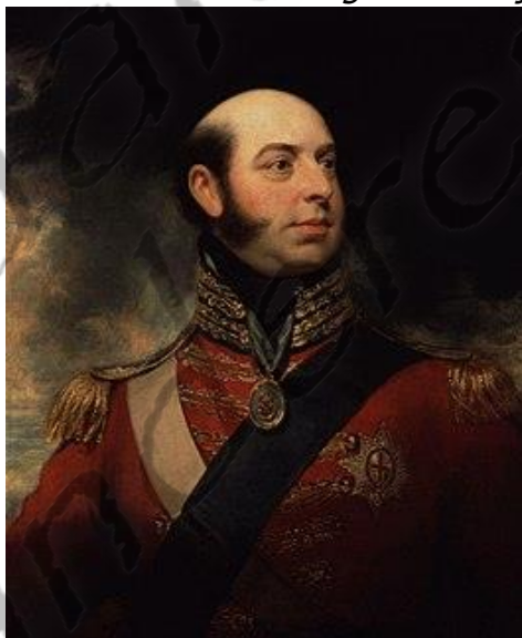
Eduard August van Kent

Als gevolg van de in Hannover geldende oude Salische Wet, die inhield dat een vrouw geen rechten kon erven, kwam hiermee een eind aan het gecombineerde koningschap. Willems broer Ernst August, hertog van Cumberland, volgde hem op als koning van Hannover.