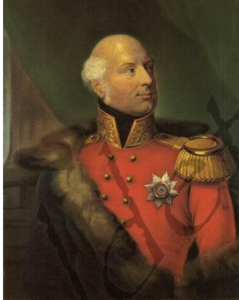
Adolf van Cambridge

Willems beide broers waren kinderloos en vervreemd van hun vrouwen die bovendien niet meer in staat waren om te baren. Hij zou bijna zeker koning worden, als hij lang genoeg zou leven, wat erg waarschijnlijk leek omdat de voormalige zeeman beter omging met zijn gezondheid dan zijn oudere broer, de Prins van Wales. De eerste keuzes van de hertog van Clarence om te huwen werden niet goedgekeurd door de Prince Regent. Zijn jongere broer Adolf, hertog van Cambridge, werd naar Duitsland gestuurd om te zoeken naar een huwbare protestantse prinses.