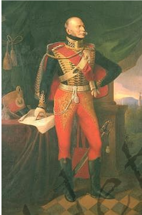
Ernst August I van Hannover