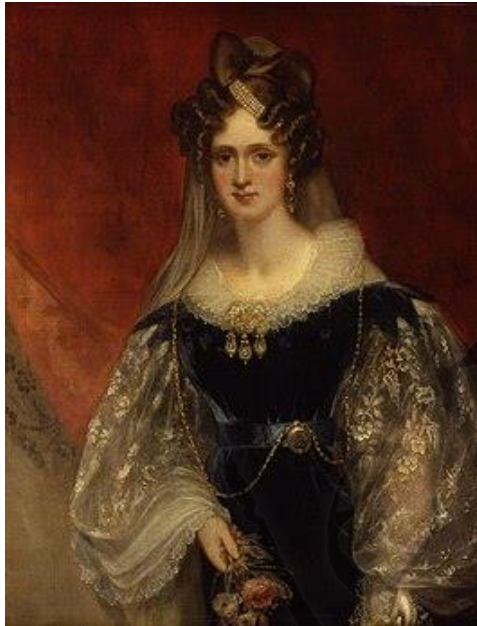
Adelheid van Saksen-Meiningen

Niet lang daarna kwam de hertog van Cambridge met een vrouw die vriendelijk en bovenal kindlievend was. Op 11 juli 1818 trouwde de bijna 53-jarige Willem te Kew met de bijna 26-jarige Adelheid van Saksen-Meiningen, een dochter van hertog George I van Saksen-Meiningen.