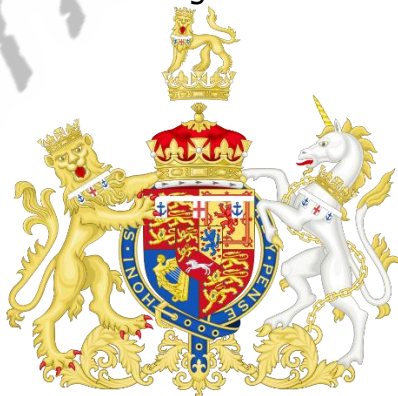
Wapenschild van 1801 tot 1830 als hertog van Clarence en St Andrews

Willem deed erg zijn best om net zoals zijn oudere broers tot hertog te worden verheven, en om een gelijke parlementaire positie te krijgen, maar zijn vader aarzelde. Om deze onder druk te zetten dreigde Willem om het Lagerhuis toe te spreken. Aldus gaf George III op 20 mei 1789 toe, door Willem te benoemen tot hertog van Clarence en Saint Andrews en graaf van Munster.