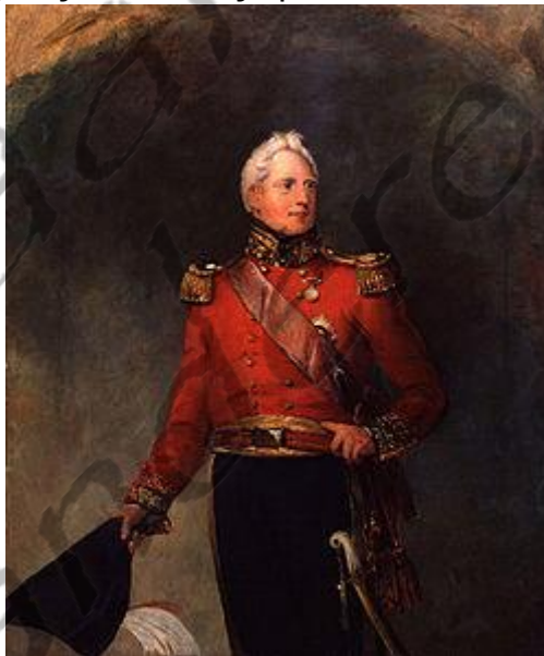
Koning Willem IV, geschilderd door William Salter

(Zijn oudere broer Frederik was drie jaar eerder overleden.) Willem IV was de oudste Britse vorst op zijn troonsbestijging tot 2022 naar hij werd overtroffen door Charles III, in zijn drieënzeventigste jaar toen hij op te troon kwam.