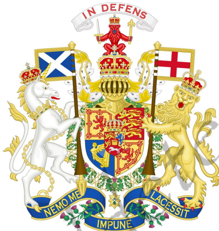
Schotse variant van het wapen van Willem als koning van het Verenigd Koninkrijk en van Hannover