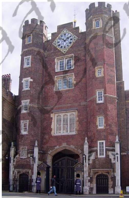
St. James's Palace

Hij had twee oudere broers (George, prins van Wales en Frederik, hertog van York) en er werd niet verwacht dat hij ooit de Kroon zou dragen. Willem werd gedoopt op 20 september 1765 in de Great Council Chamber te St. James's Palace in Londen.