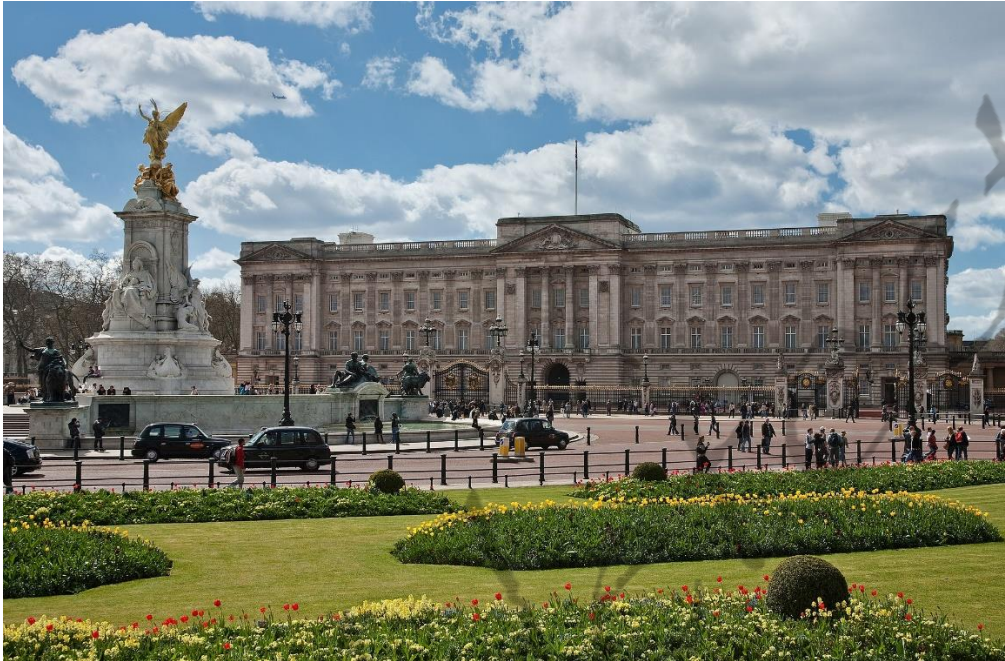
Buckingham Palace in Londen

Willem werd geboren in de vroege uren van 21 augustus 1765 in Buckingham Palace, als derde kind en zoon van koning George III en koningin Charlotte.