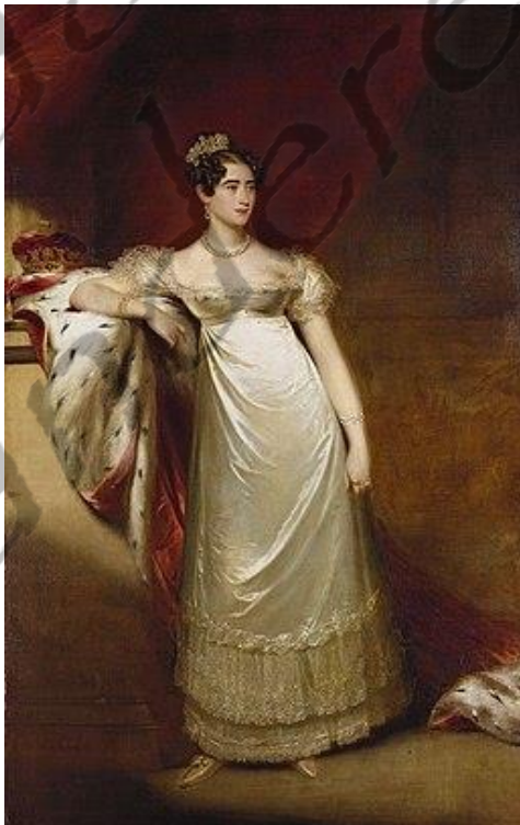
Augusta van Hessen-Kassel

Hij kwam terug met Augusta van Hessen-Kassel, die door Willem afgewezen werd, waarop Adolf met haar trouwde.