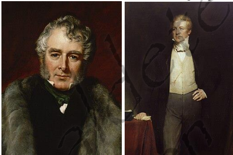
William Lamb & Robert Peel

De eigenlijke constitutionele macht ging door de veranderingen over van de koning naar het parlement. Willem was ook de laatste vorst die een minister-president benoemde tegen de wensen van het parlement in. De liberale William Lamb moest het veld ruimen en de conservatieve Tories vormden een regering onder Robert Peel.