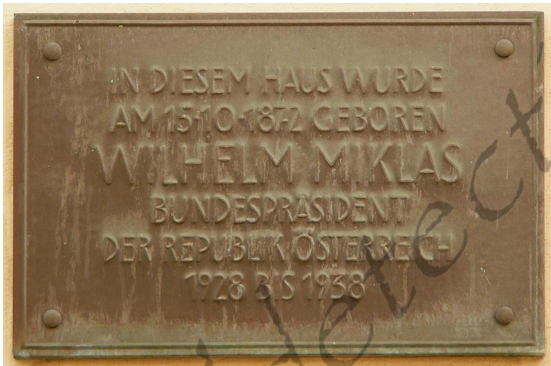
Gedenkplaat bij de geboorteplaats van Wilhelm Miklas

Wilhelm Miklas, was een Oostenrijks politicus. Hij studeerde rechten te Wenen en was docent aan een gymnasium. Tijdens zijn studies was hij lid van K.Ö.St.V. Austria Wien, een Oostenrijkse studentenvereniging die lid was van het Cartellverband der katholischen deutschen Studentenverbindungen.