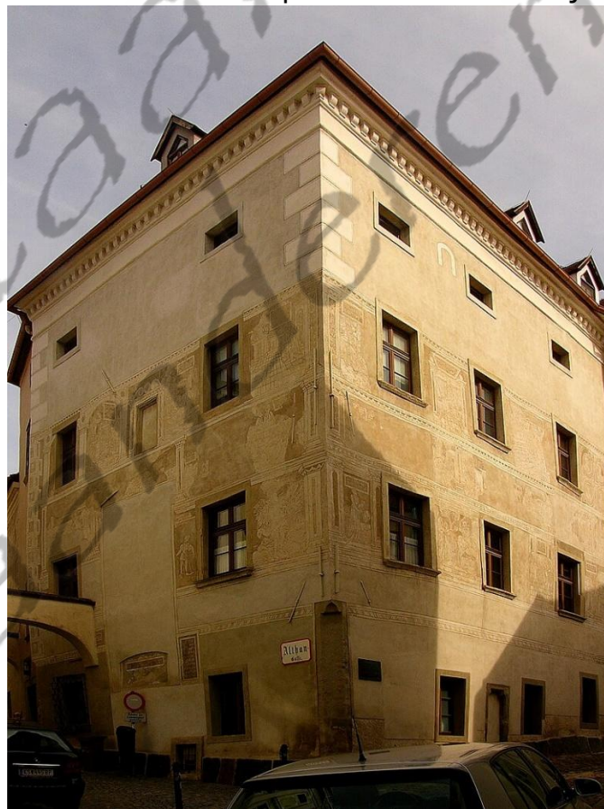
De geboorteplaats van Wilhelm Miklas aan de Althangasse in Krems

1928-1938: Bondspresident van Oostenrijk