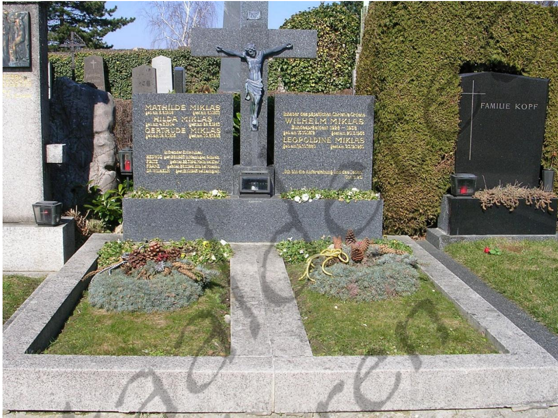
Het graf van Miklas op de begraafplaats van Döbling

Na zijn overlijden werd hij op 20 maart 1956 begraven in het familiegraf op de begraafplaats van Döbling (groep 2, rij 2, nummer 13A).