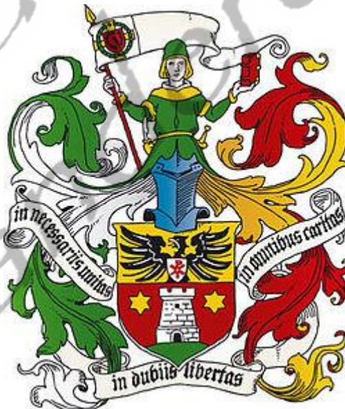
Wapenschild van het Cartellverband der katholischen deutschen Studentenverbindungen