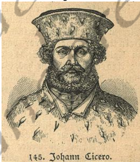
Johann Cicero van Brandenburg

Op 16 februari 1507 huwde Hendrik V met Ursula (1488-1510), dochter van keurvorst Johann Cicero van Brandenburg.