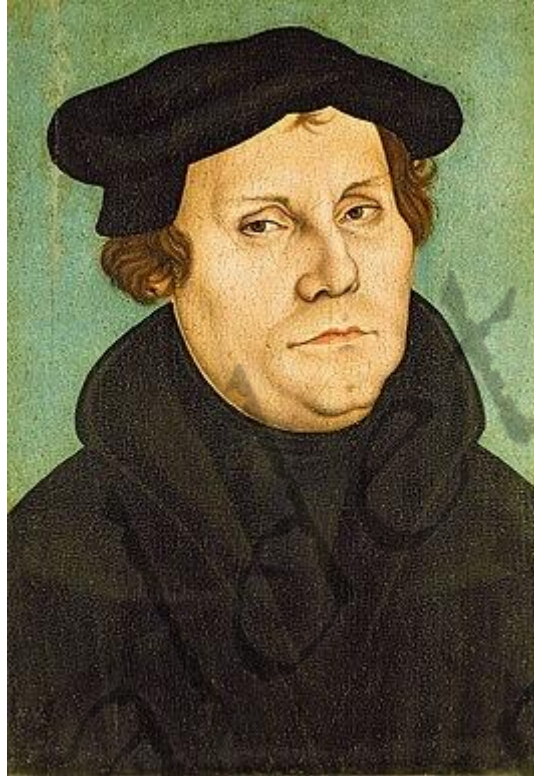
Maarten Luther geschilderd door Lucas Cranach de Oude in 1528.

Mecklenburg-Schwerin mocht regeren, terwijl Albrecht VII Mecklenburg-Güstrow mocht besturen. Er vond echter geen formele deling van Mecklenburg plaats. Het was tijdens de regeerperiode van Hendrik V en Albrecht VII dat Maarten Luther de Reformatie lanceerde, die snel voorstanders vond in Mecklenburg en vanaf 1523 werd het lutherse geloof in Mecklenburg gepredikt.