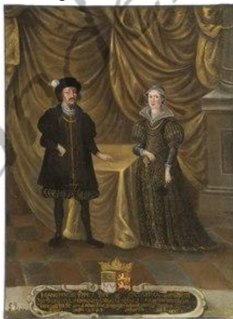
Magnus I van Saksen-Lauenburg en Katharina von Braunschweig-Wolfenbüttel

Na de dood van Helena sloot Hendrik V op 14 mei 1551 een derde huwelijk, ditmaal met Ursula (1523-1577), dochter van hertog Magnus I van Saksen-Lauenburg en zijn vrouw Katharina von Braunschweig-Wolfenbüttel.