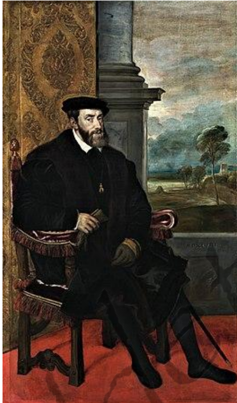
Keizer Karel V in Augsburg. Geschilderd door Titiaan in 1548.

In juli 1549 keurde Hendrik V de beslissing van de Mecklenburgse Staten goed om het lutheraans geloof officieel te erkennen als staatsgodsdienst.