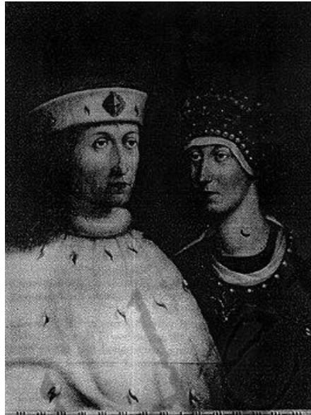
Keurvorst Filips van de Palts

Na de dood van zijn eerste echtgenote hertrouwde Hendrik V op 12 juni 1513 met Helena (1493-1524), dochter van keurvorst Filips van de Palts.