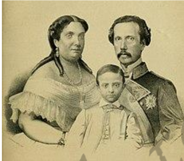
Portret van Prins Alfonso op ongeveer zevenjarige leeftijd met zijn moeder Isabel II en zijn vader Francisco de Asís de Borbón.

Hij was de zoon van koningin Isabella II en, althans officieel, van haar neef en echtgenoot Frans van Assisi.