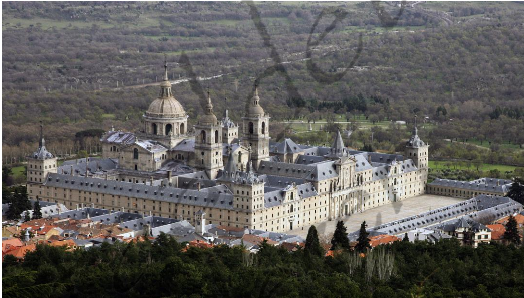
Het klooster van El Escorial gezien vanuit de lucht en vanaf de berg Abantos

De dood van koning Alfonso XII veroorzaakte een diepe schok in het land. "De straten [van Madrid] waren onbegaanbaar... Duizenden rijtuigen staken alle kanten op en namen de weg naar El Pardo", zo verhaalt een kroniek uit die tijd. De kist werd naar het Koninklijk Paleis gebracht, waar de rouwkapel werd ingericht en door duizenden mensen werd bezocht. Op de 29e werd hij naar het klooster van El Escorial gebracht, "opnieuw te midden van een grote menigte", waar hij werd begraven.