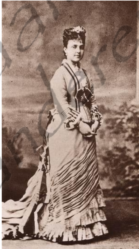
Maria de las Mercedes van Orléans

Alfons huwde in 1878 María de las Mercedes, dochter van Anton van Orléans-Montpensier. Zij stierf echter al na enkele maanden.