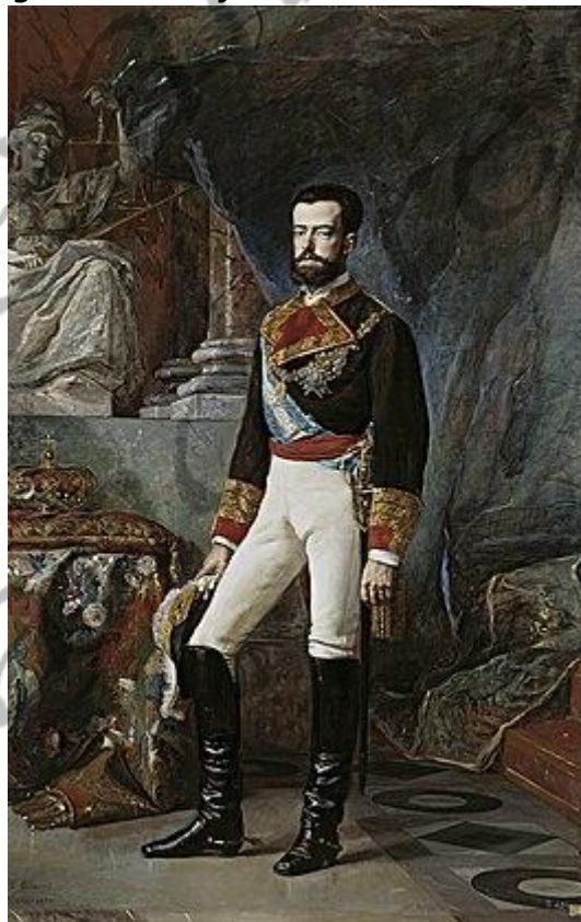
Amadeus I van Spanje

Hij vergezelde zijn moeder nadat zij in 1868 was afgezet naar het buitenland en groeide op in Wenen en het Verenigd Koninkrijk. Isabella deed in 1870 te zijnen gunste afstand van (haar aanspraak op) de troon. In de chaos van de Eerste Spaanse Republiek, die volgde op de troonsafstand van de in 1870 tot koning gekozen Amadeus I, kregen uiteindelijk de alfonsistische krachten de overhand.