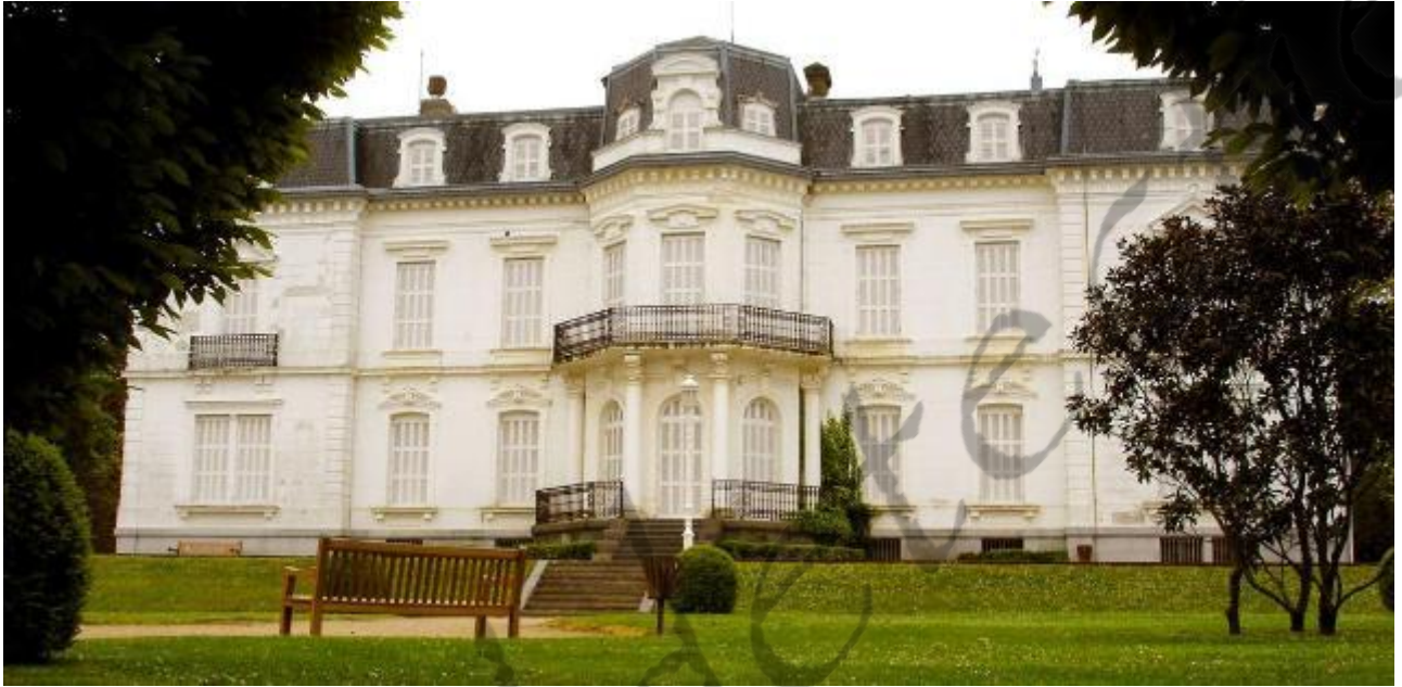
Paleis van Aiete in San Sebastian

koningschap groeide. Alfons XII en zijn vrouw koningin Maria Cristina brachten hun zomers door in het Paleis van Aiete in San Sebastian, waardoor voornamelijk onder invloed van de koningin die stad zich ontwikkelde tot een elegante badplaats.