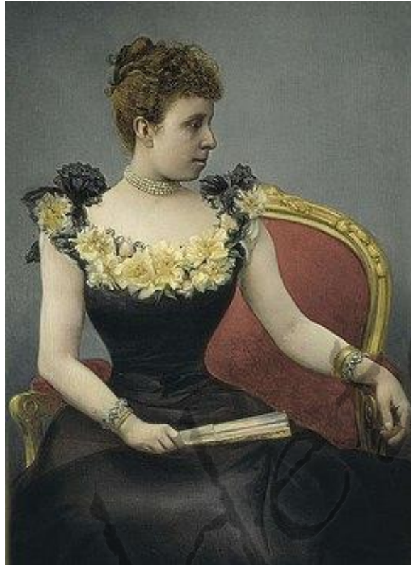
Maria Christina van Oostenrijk

Uit dit huwelijk werden drie kinderen geboren: