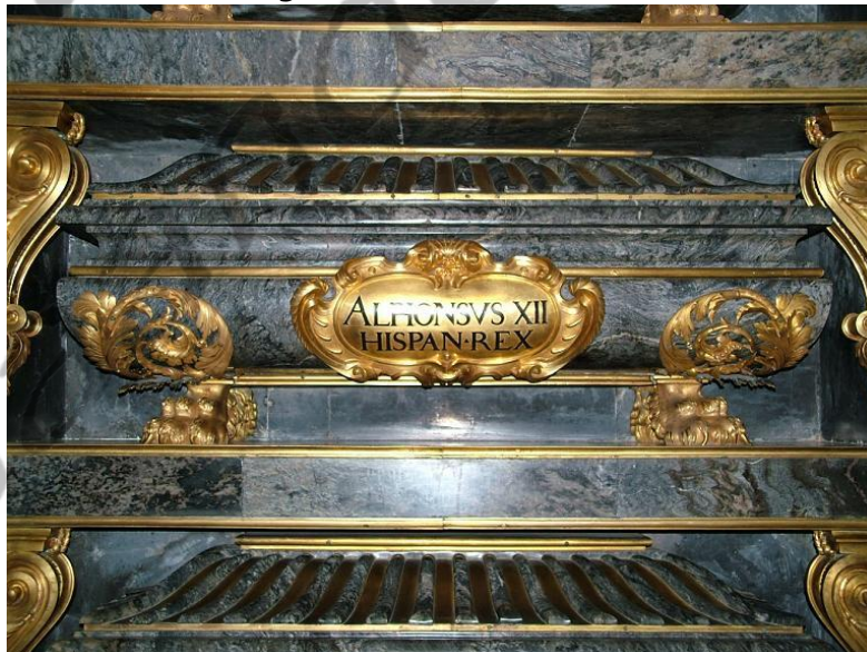
Graf van Alfonso XII