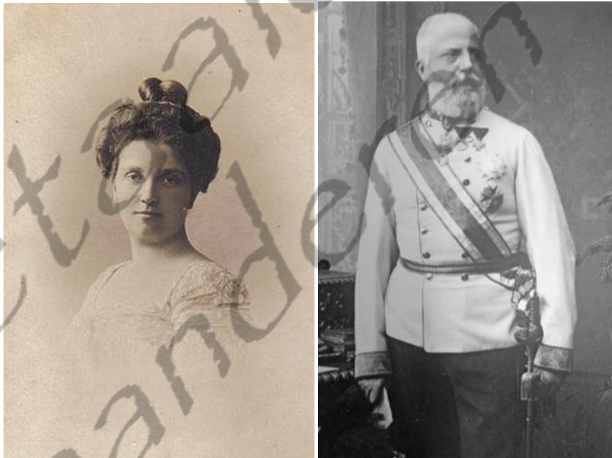
Louise van Habsburg-Lotharingen en Ferdinand IV van Toscane