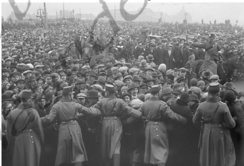
Menigte bij de begrafenisstoet