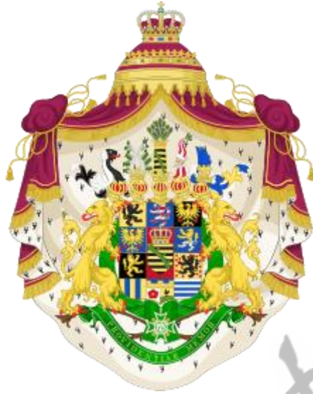
Wapen van de koning van Saksen