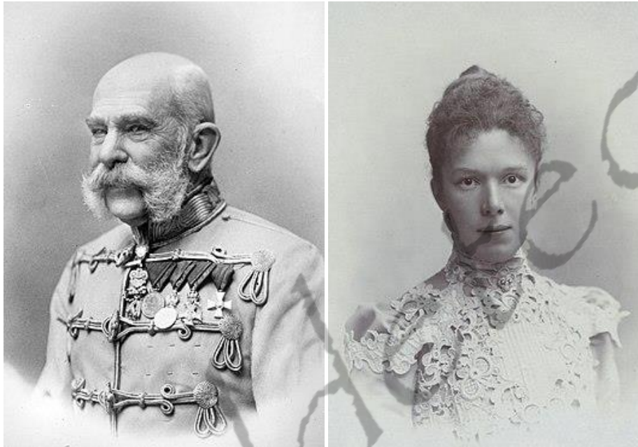
Frans Jozef I van Oostenrijk en Marie Valerie van Oostenrijk

Na eerst gedongen te hebben naar de hand van de jongste dochter van de Oostenrijkse keizer Frans Jozef I, Valerie, trad hij op 21 november 1891 in Wenen in het huwelijk met Louise van Oostenrijk-Toscane, dochter van Ferdinand IV van Toscane.