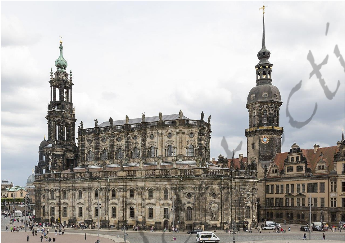
Katholische Hofkirche (Dresden)