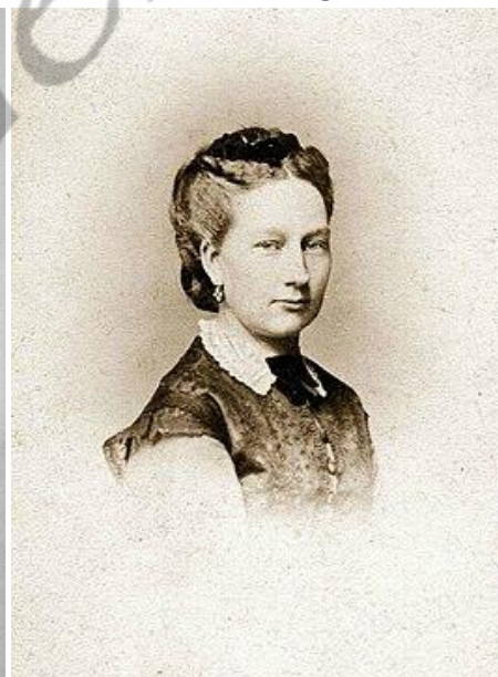
George van Saksen en Maria Anna van Portugal