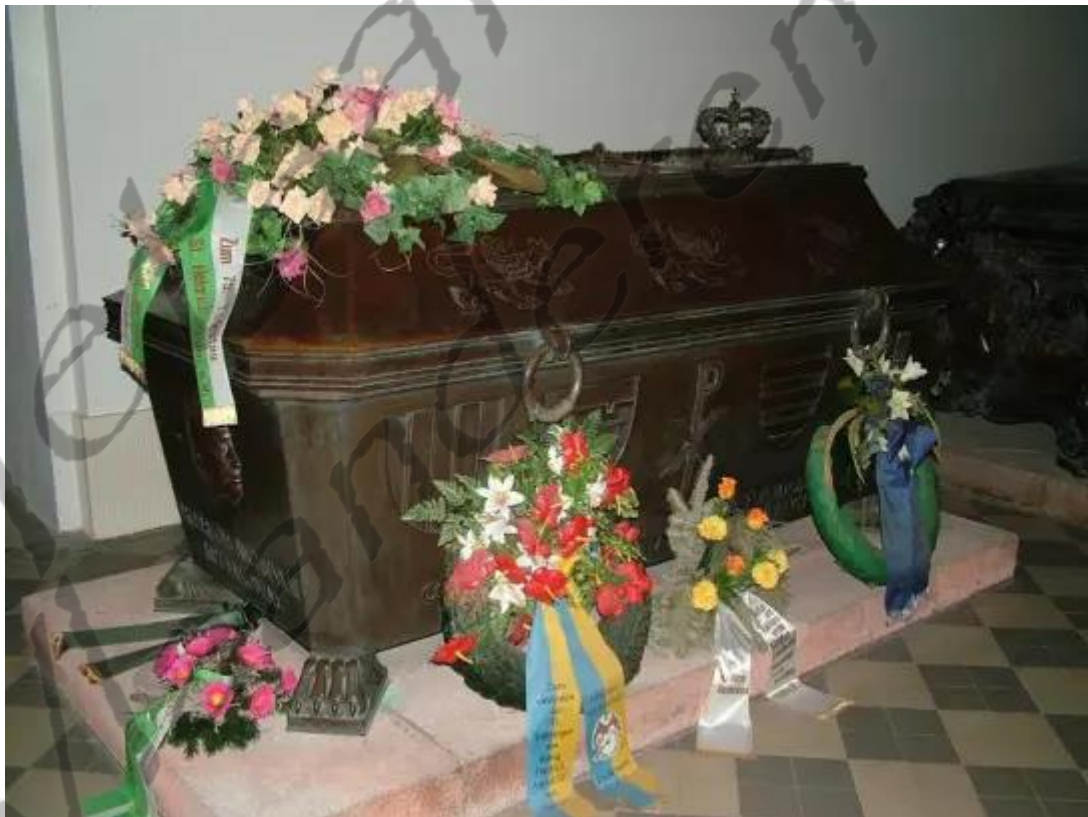
Tombe van Frederik August III van Saksen