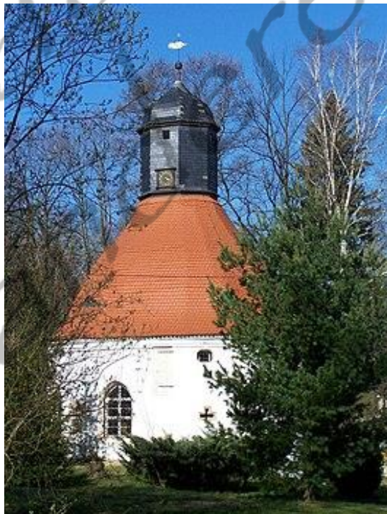
Kerk van Gutebor

De Novemberrevolutie van 1918 bereikte ook Saksen. Op 13 november van dat jaar deed Frederik August zonder weerstand te bieden op het slot Guteborn bij Ruhland troonsafstand.