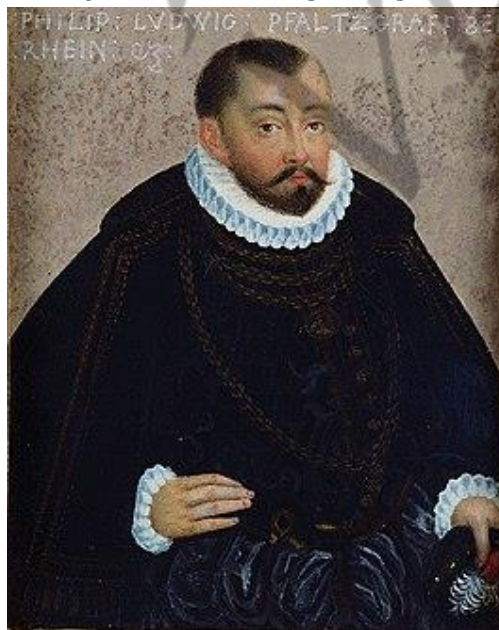
Filips Lodewijk van Palts-Neuburg

Toen Wolfgang in 1569 tijdens een veldtocht in Frankrijk stierf werden zijn bezittingen onder zijn vijf zoons verdeeld. Johan erfde het stamland Palts-Zweibrücken, terwijl zijn oudere broer Filips Lodewijk Palts-Neuburg kreeg.