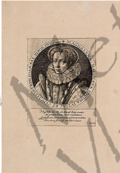
Magdalena van Kleef

In 1579 trouwde Johan met Magdalena van Kleef (1553-1633), een dochter van hertog Willem de Rijke.