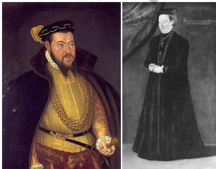
Wolfgang van Palts-Zweibrücken en Anna van Hessen

Johan was de tweede zoon van Wolfgang van Palts-Zweibrücken en Anna van Hessen.