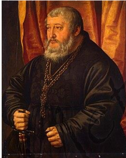
Otto Hendrik van de Palts

Zijn vader had in 1557 het vorstendom Palts-Neuburg aan de Donau gekregen van keurvorst Otto Hendrik van de Palts.