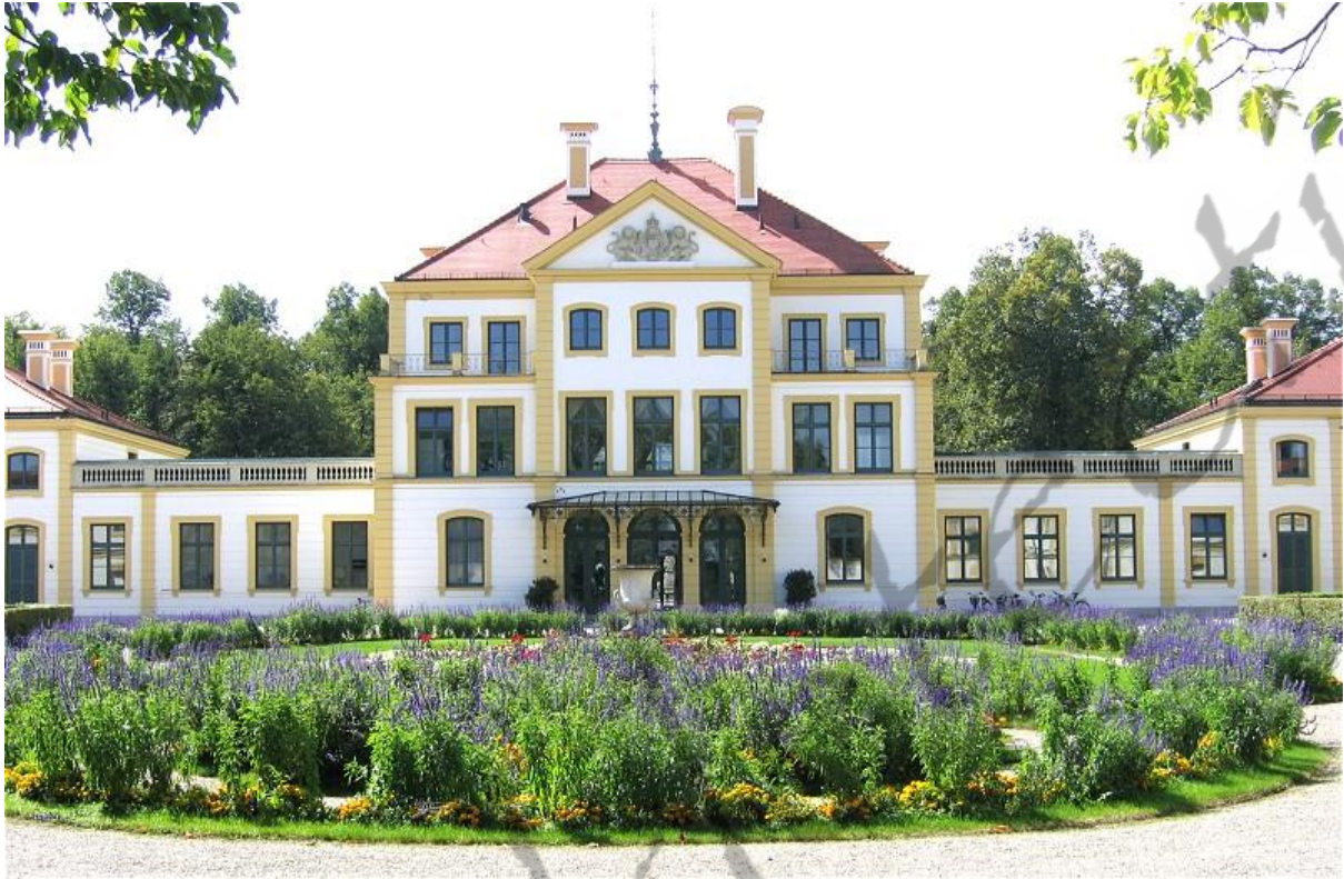
Paleis Fürstenried (München)

Koning Otto is begraven in de koninklijke crypte van de Sint-Michaëlkerk in München.