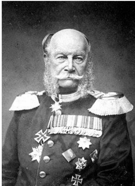
Wilhelm I van Duitsland

Hij nam dienst in het leger en verbleef in 1870/1871 in het hoofdkwartier van Wilhelm I te Versailles.