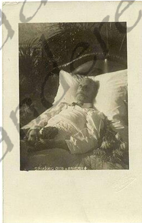
Otto I op zijn sterfbed

Na het overlijden van Luitpold in 1912 volgde diens zoon hem op als prins-regent en werd op 5 november 1913 als Lodewijk III tot koning gekroond. Otto behield echter tot zijn dood eveneens de koningstitel. Hij stierf op 11 oktober 1916 in Paleis Fürstenried.