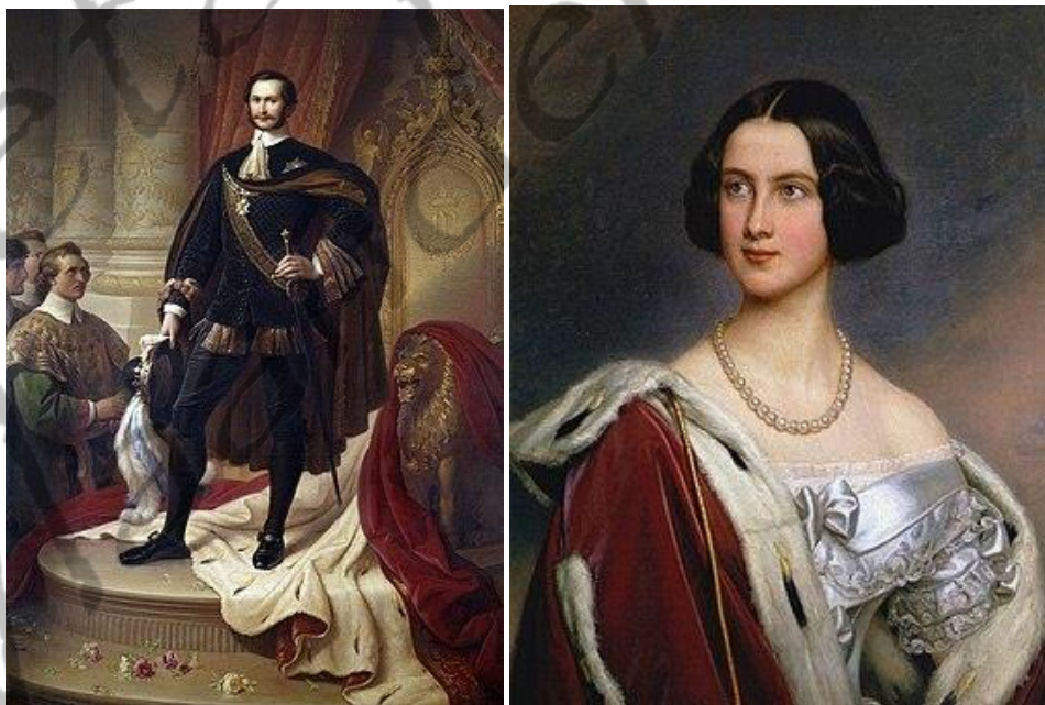
Maximiliaan II van Beieren en Marie van Pruisen

Otto Willem Luitpold Adalbert Waldemar was van 1886 tot 1913 koning van Beieren. Hij was de tweede zoon van Maximiliaan II en Marie van Pruisen, dochter van prins Willem van Pruisen.