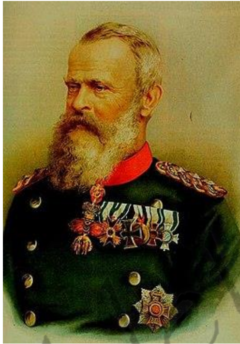
Luitpold van Beieren

Na het overlijden van Luitpold in 1912 volgde diens zoon hem op als prins-regent en werd op 5 november 1913 als Lodewijk III tot koning gekroond. Otto behield echter tot zijn dood eveneens de koningstitel. Hij stierf op 11 oktober 1916 in Paleis Fürstenried.