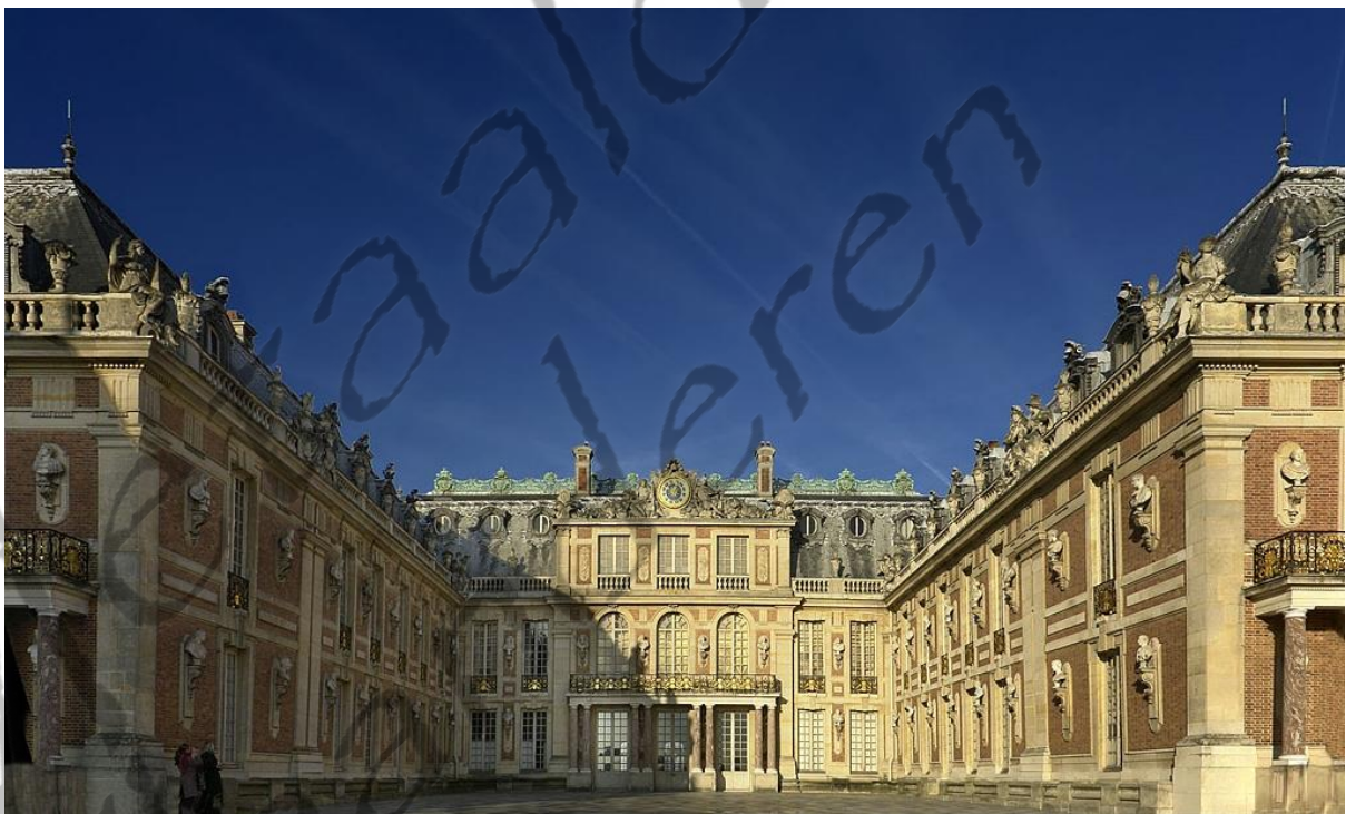
Kasteel van Versailles: In 1871 werd hier Wilhelm I van Pruisen uitgeroepen tot Duits keizer

In 1872 werd hij echter geestesziek en hij leefde sindsdien teruggetrokken te Fürstentfeldbruck. Toen zijn eveneens krankzinnig verklaarde broer Ludwig II in 1886 stierf, werd hij tot koning uitgeroepen. Omdat hij echter tot regeren volstrekt niet in staat was ( "de koning is zwaarmoedig" , heette het officieel), trad zijn oom Luitpold als prins-regent op.