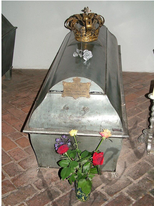
Sarcofaag van Koning Otto I in de Sint-Michaëlkerk ( München )