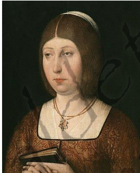
Isabella I van Castilië

In 1459 vonden onderhandelingen plaats over een eventueel huwelijk tussen Karel van Viana, destijds 38 jaar oud, en de dochter van Johan II van Castilië, Isabel, destijds 9 jaar oud.