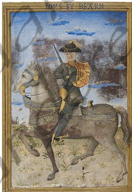
Gaston IV van Foix

Op 3 december 1455 sloten Johan II van Aragón en Gaston IV van Foix het Verdrag van Barcelona .