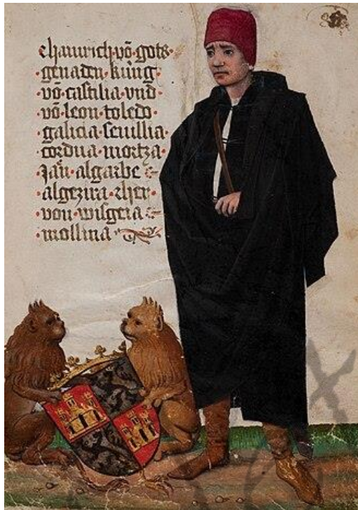
Hendrik IV van Castilië

Op 3 december 1455 sloten Johan II van Aragón en Gaston IV van Foix het Verdrag van Barcelona .