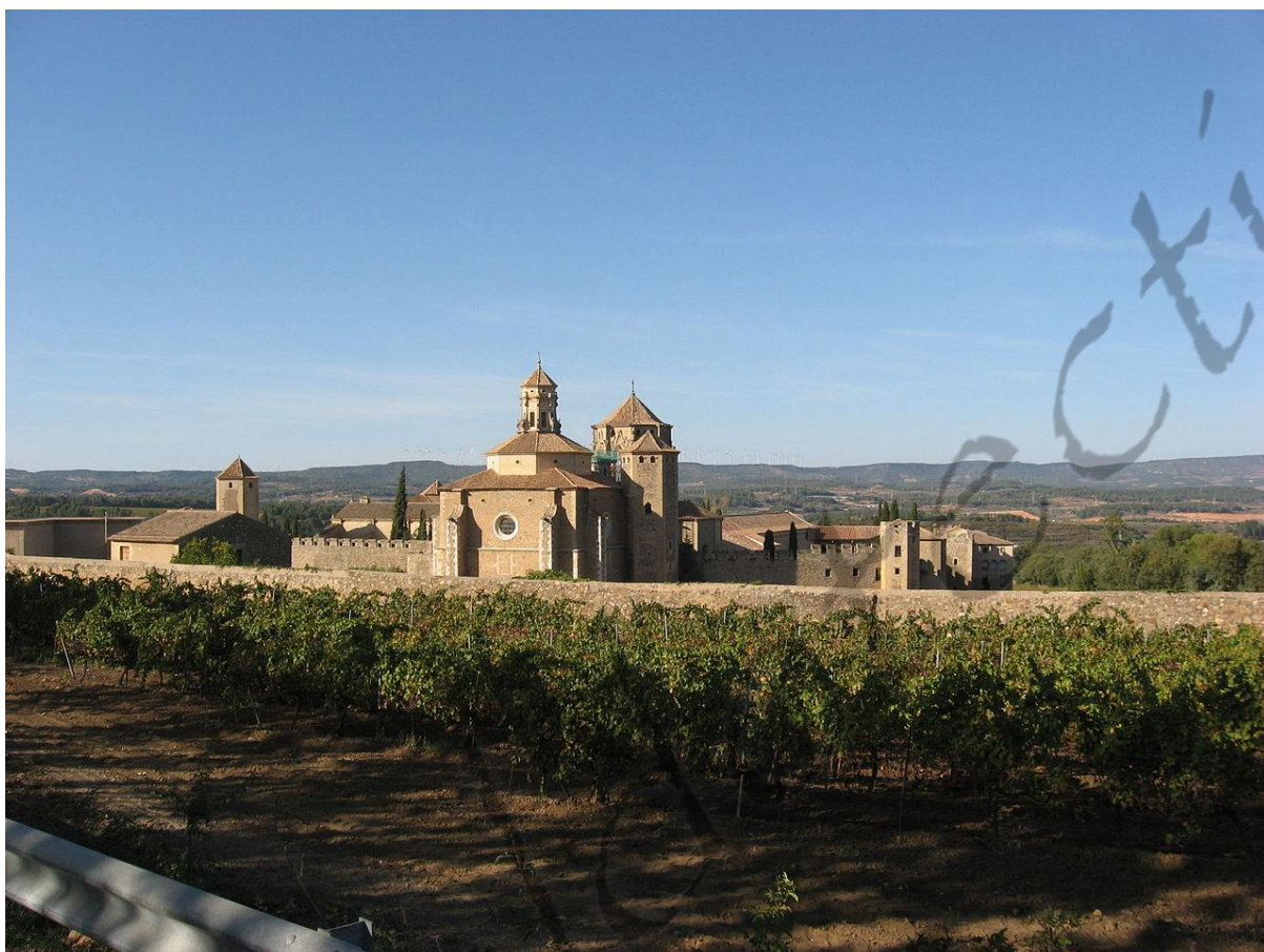
Klooster van Poblet