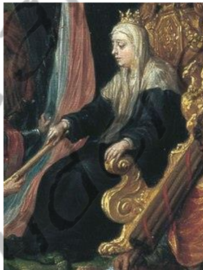
Blanca I van Navarra

Johan was behalve Prins van Aragón ook de 2e hertog van Peñafiel, een titel die hij van zijn vader erfde. Hij trouwde in 1420 met Blanca I van Navarra, weduwe van Martinus I van Sicilië, dochter van Karel III van Navarra.