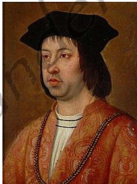
Ferdinand II of Aragon

De tegenstanders van Karel zagen echter meer in een huwelijk tussen zijn halfbroer Ferdinand, die toen 7 jaar was.