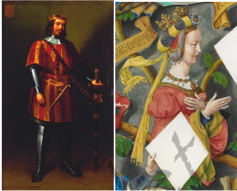
Zijn ouders: Ferdinand I van Aragón en Eleonora Urraca van Castilië