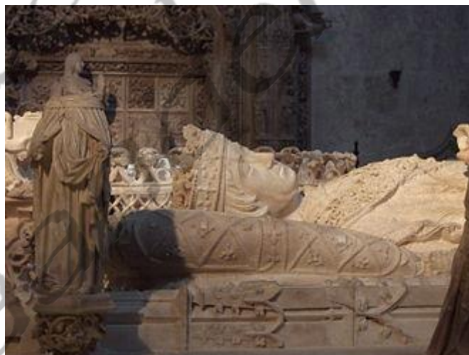
Tombe van Johan II van Castilië

Na de dood van Johan II van Castilië op 22 juli 1454 ontstond weer oorlog tussen vader en zoon, Johan en Karel.