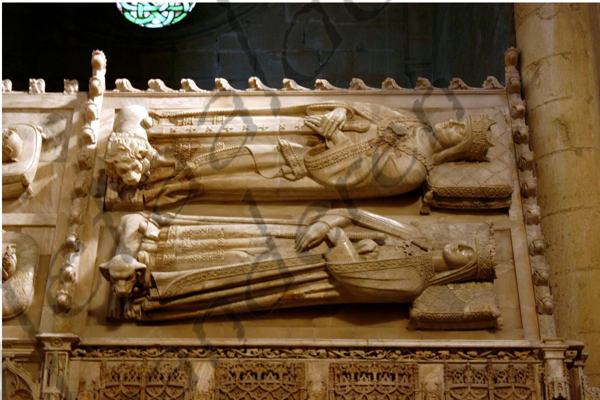
Graven van Johannes II en koningin Juana Enríquez in het klooster van Poblet.